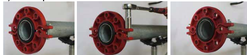
Рис. 1. Монтаж накидного разъемного фланца «LEDE».